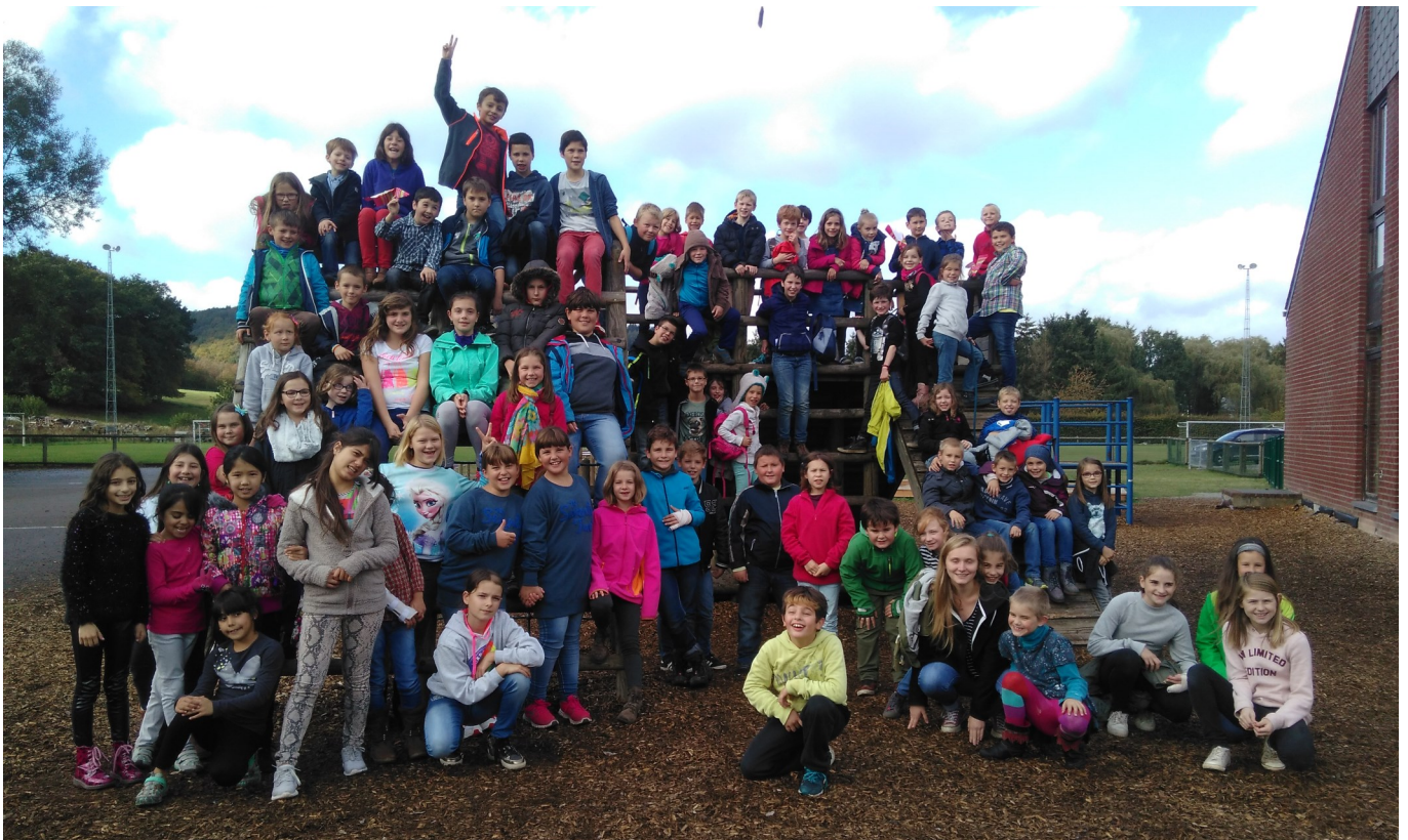
Le groupe des enfants qui ont participé à la journée « Place aux enfants »

En collaboration avec la Ligue des Familles, le C.P.A.S. a organisé l'événement « Place aux enfants » qui permet aux jeunes de découvrir le monde des adultes. En matinée, ils ont eu l'occasion de simuler un mariage à la Maison communale, de constituer un conseil communal et de débattre de leurs projets. L'après-midi, ils se sont répartis en groupes chez les différents hôtes qui avaient accepté de les accueillir. Au total, 72 enfants ont